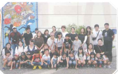
須磨の海浜水族園に行ったよ