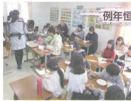
例年恒例の「餅つき大会」