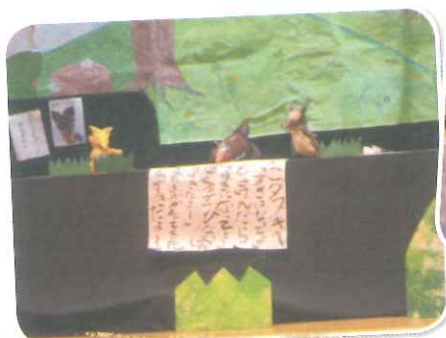
人形劇「ねずみ小僧」