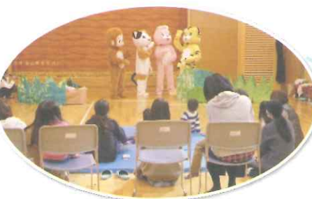
今年も常盤幼稚園児 を対象にした、着ぐるみ ショー開催