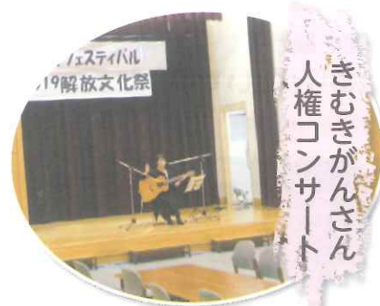
きむきがんさん 人権コンサート

今年も人権フェスティバルで印岐志呂太鼓、カラオケ教室にダンス、第四保育所の子どもたちの発表を披露したよ!