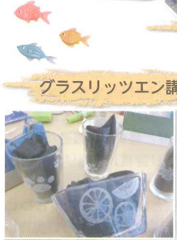
グラスリッツエン講座