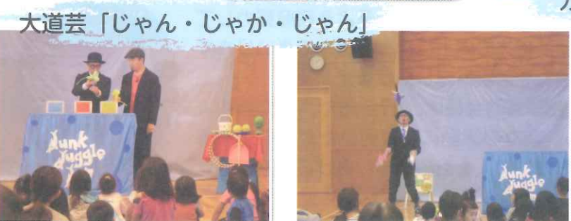
大道芸「じゃん・じゃか・じゃん」