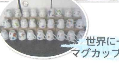
世界に一つだけのマグカップ作りに挑戦！

私たちは大満足の家を創っています エールコーポレーション株式会社 本社：滋賀県草津市北大萱町556-2 フリーダイヤル：0120-168-3190 TEL: 077-5681-3190 FAX: 077-5681-3773