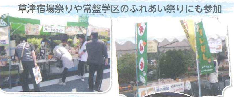
草津宿場祭りや常盤学区のふれあい祭りにも参加