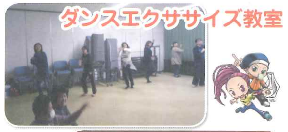
ダンスエクササイズ教室