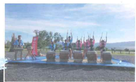
町祭礼・よし松明祭 人権フェスティバルと大活躍