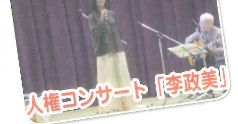
人権コンサート「李政美」