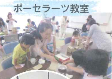
ポーセラーツ教室