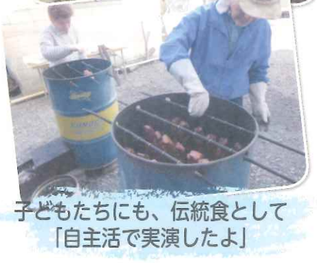
子どもたちにも、伝統食として「自主活で実演したよ」