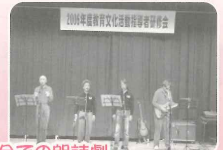
宿場まつりでの太鼓や部落解放滋賀県集会での朗読劇、 教育文化活動指導者研修会での人権コンサートなど各地で啓発をしました!