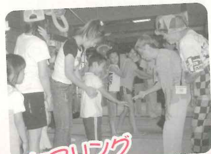
ボウリング クラウン