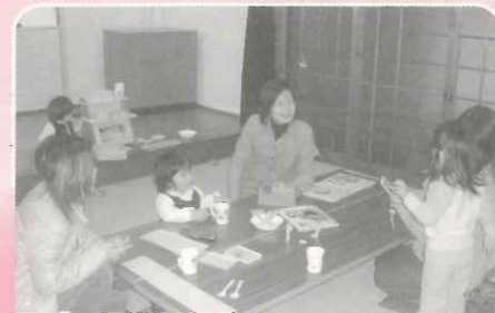
子育てサロン(毎月2回開催)