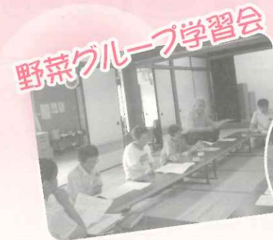
野菜グループ学習会