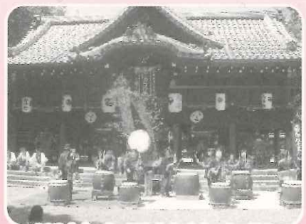
印岐志呂神社大祭