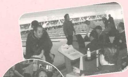
近隣町 ボウリング大会