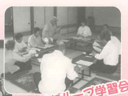
野菜グループ学習会