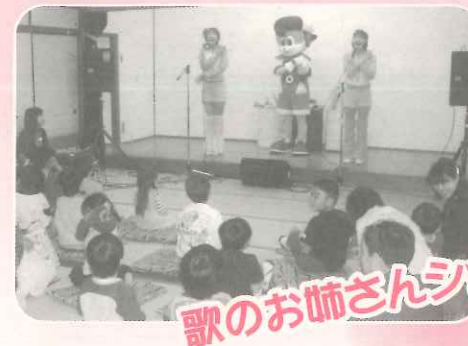
歌のお姉さんショー