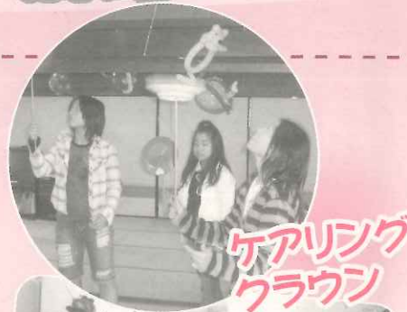
ケアリング クラウン