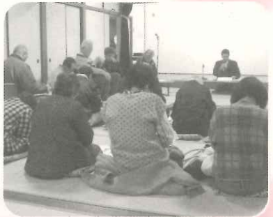
後期高齢者 保険制度説明会