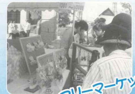
フリーマーケット