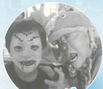
ヘアリング クラウン