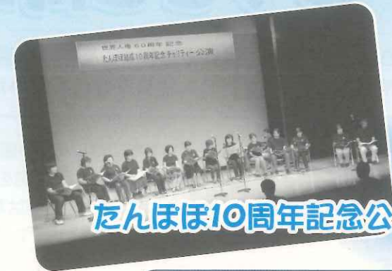
たんぼほ10周年記念公演