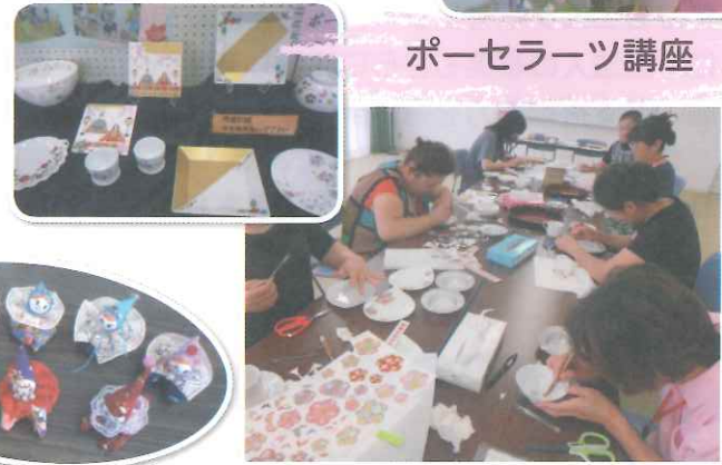
ポーセラーツ講座