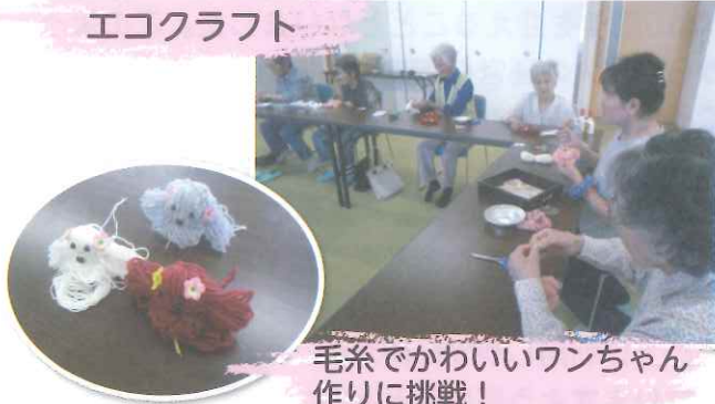
毛糸でかわいいワンちゃん 作りに挑戦!