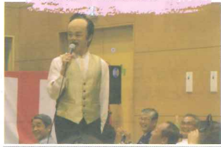
お笑いものまねショー